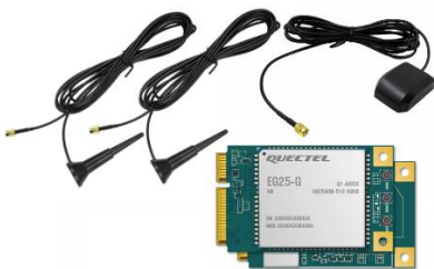
ZN-AIBOX-LTE-KIT Moduł LTE/GPS