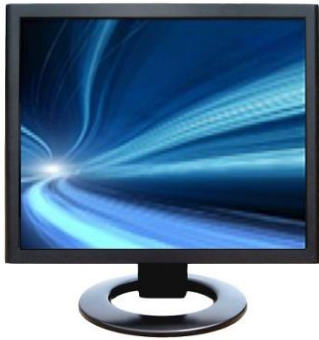
Monitor LED 4:3 do pracy ciągłej