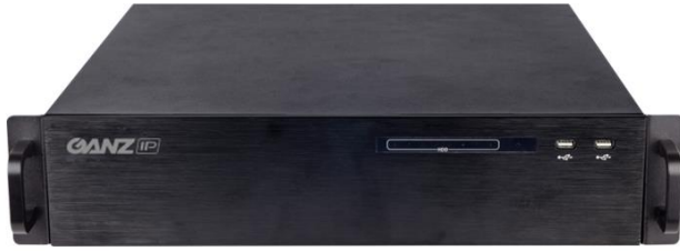
Rejestrator sieciowy 64-kanalowy